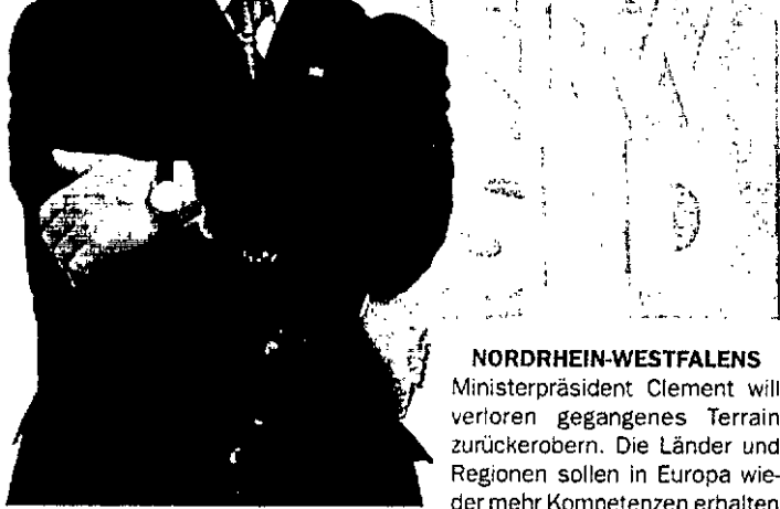
NORDRHEIN-WESTFALENS Ministerpräsident Clemens will verloren gegangenes Terrain zurückerobern. Die Länder und Regionen sollen in Europa wieder mehr Kompetenzen erhalten