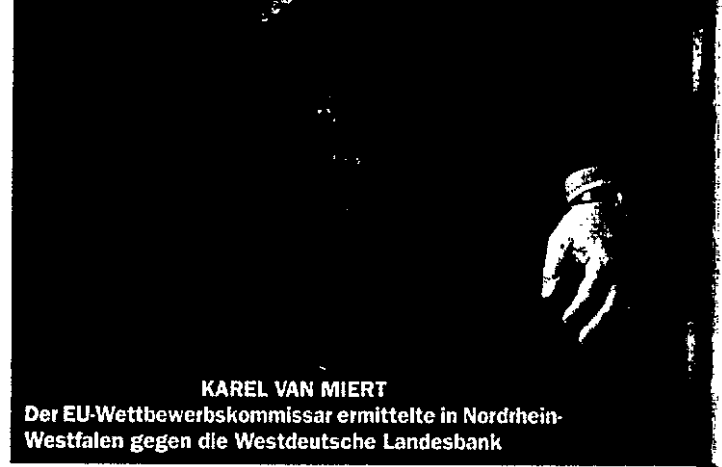
KAREL VAN MIERT Der EU-Wettbewerbskommissar ermittelte in Nordrhein-Westfalen gegen die Westdeutsche Landesbank