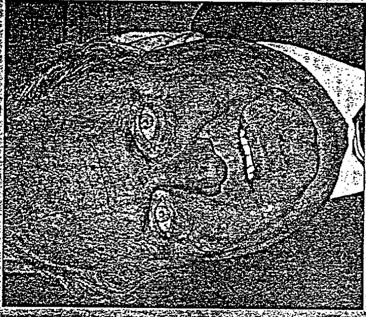
1999 Vor 20 Jahren war das Gatt hoch im Klub der Weißen der Klub der Reichen. Das ist jetzt vorbei. Mike Moore WTO-Generaldirektor

Es müsse sichergestellt werden, dass die ausgehandelten Regeln fair, verständlich und anwendbar seien. Auch müsse den Entwicklungsländern bei der Umsetzung besser geholfen werden. "Das bedeutet vorwiegend technische und finanzielle Hilfe". Zudem will sich Moore für Zollfreiheit auf alle Exporte aus den armen Staaten der Welt einsetzen. "Das würde einen enormen moralischen Schub für unsere Sache geben, und es ist eine Frage der Gerechtigkeit". Zusammen handele es sich um ein Volumen von 0,5 Prozent des gesamten Welthandels. Von den 48 LDC (Least Developed Countries) sind 29 Mitglieder der WTO. Neben den Entwicklungsländern will Moore sein Augenmerk auf die WTO- und freihandelskritischen Nichtregierungsorganisationen und die Öffentlichkeit in den Mitgliedsländern richten. Für Seattle haben sich