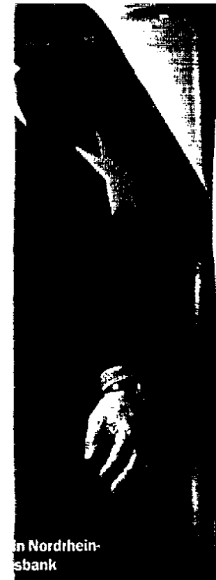
n Nordrhein- sbank