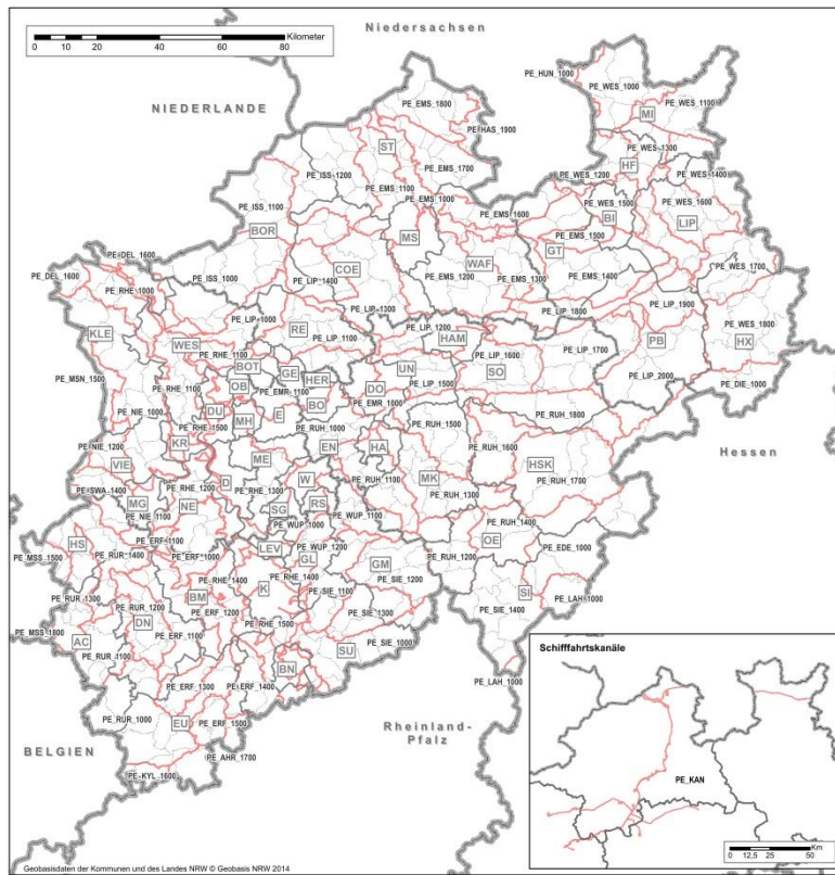
Planungseinheiten und Verwaltungsgrenzen in NRW