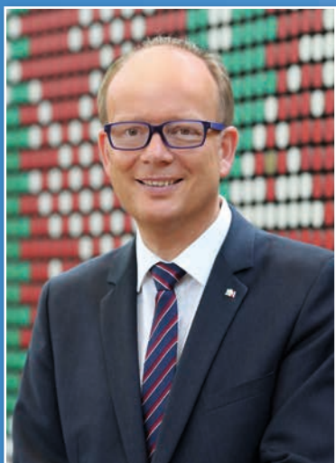
André Kuper Präsident des Landtags Nordrhein-Westfalen